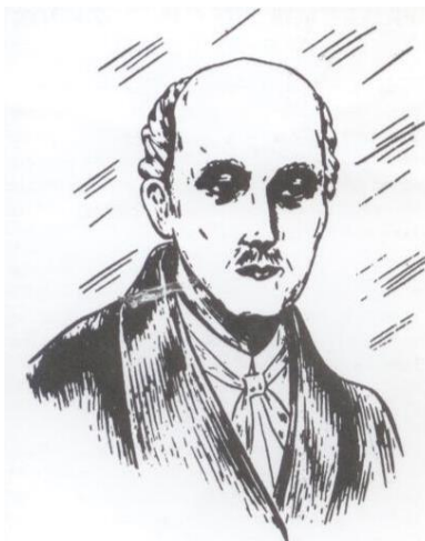
Rysunek przedstawiający Sługę Bożego Mateusza Talbota

Kształtuj moje wnętrze i naucz mnie stawiać sobie wymagania. Wierzę, że z Twoją pomocą stanę się człowiekiem nie tylko wolnym, ale i oddanym do Twojej dyspozycji. Pomóż mi jednak zachować taką czujność, aby nie ulegać pokusom. Amen.